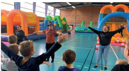
Des activités qui enchantent nos jeunes.

L'AMI dispose désormais d'un local municipal en centre ville pour faciliter son action dans les communes voisines.