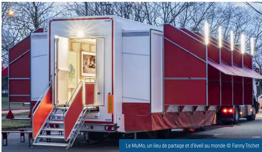
Le MuMo, un lieu de partage et d'éveil au monde

Une première à Vitry : de nombreuses œuvres vont aller à la rencontre du public, et non l'inverse ! Un événement gratuit, proposé en partenariat avec la Communauté de communes Osartis-Marquion.