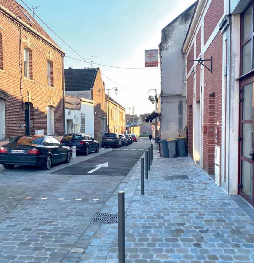
Rue de l'Abreuvoir désormais en sens unique