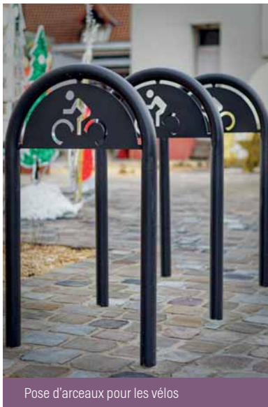
Pose d'arceaux pour les vélos

La réhabilitation de notre centre ville était programmée en deuxième partie du mandat. La municipalité, a préféré, en toute logique et afin d'éviter de multiplier les interventions, profiter des travaux de rénovation des réseaux d'assainissement et d'adduction d'eau potable engagés en février 2022 par Noréade pour aussitôt après enclencher le chantier. L'aménagement proprement