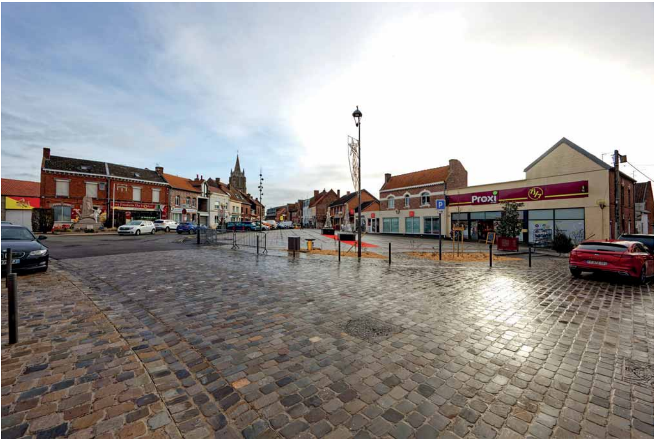
Pavage en grés d'Artois de la place, des chaussée et des trottoirs

terres végétalisés, l'installation de mobilier urbain spécifique, le renouvellement de l'éclairage public... ont été imaginés pour donner envie aux Vitryens et badauds de passage de venir s'y poser et s'y détendre. L'objectif était aussi de renforcer qualitativement, l'identité visuelle du cœur de Vitry, grâce notamment à la teinte gris sablé.