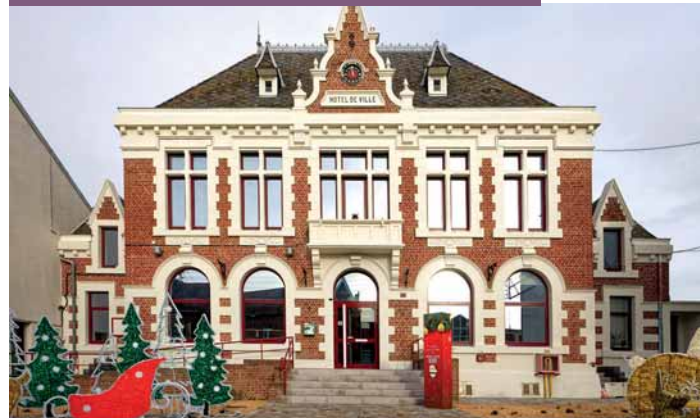
Nouveau visage pour notre maison commune

Une offre commerciale diversifiée et de qualité, une forte concentration de services publics (mairie, école, Poste, maison France services, médiathèque, salle polyvalente très utilisée), une présence grandissante de professionnels de santé (dont récemment un ophtalmologue)... le centre de Vitry-en-Artois attire de plus en plus de monde. Sans compter un afflux de clientèle consécutif à la fermeture de banques dans les communes alentours. Autre raison de sa forte fréquentation : l'inévitable traversée de deux voies départementales. Consciente des difficultés que ce succès entraîne, la municipalité a fait du réaménagement de ce cœur battant de la ville, le chantier phare de ce mandat. En réaffirmant de très fortes priorités !